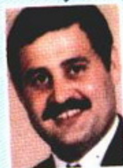
د. نبيل فاروق