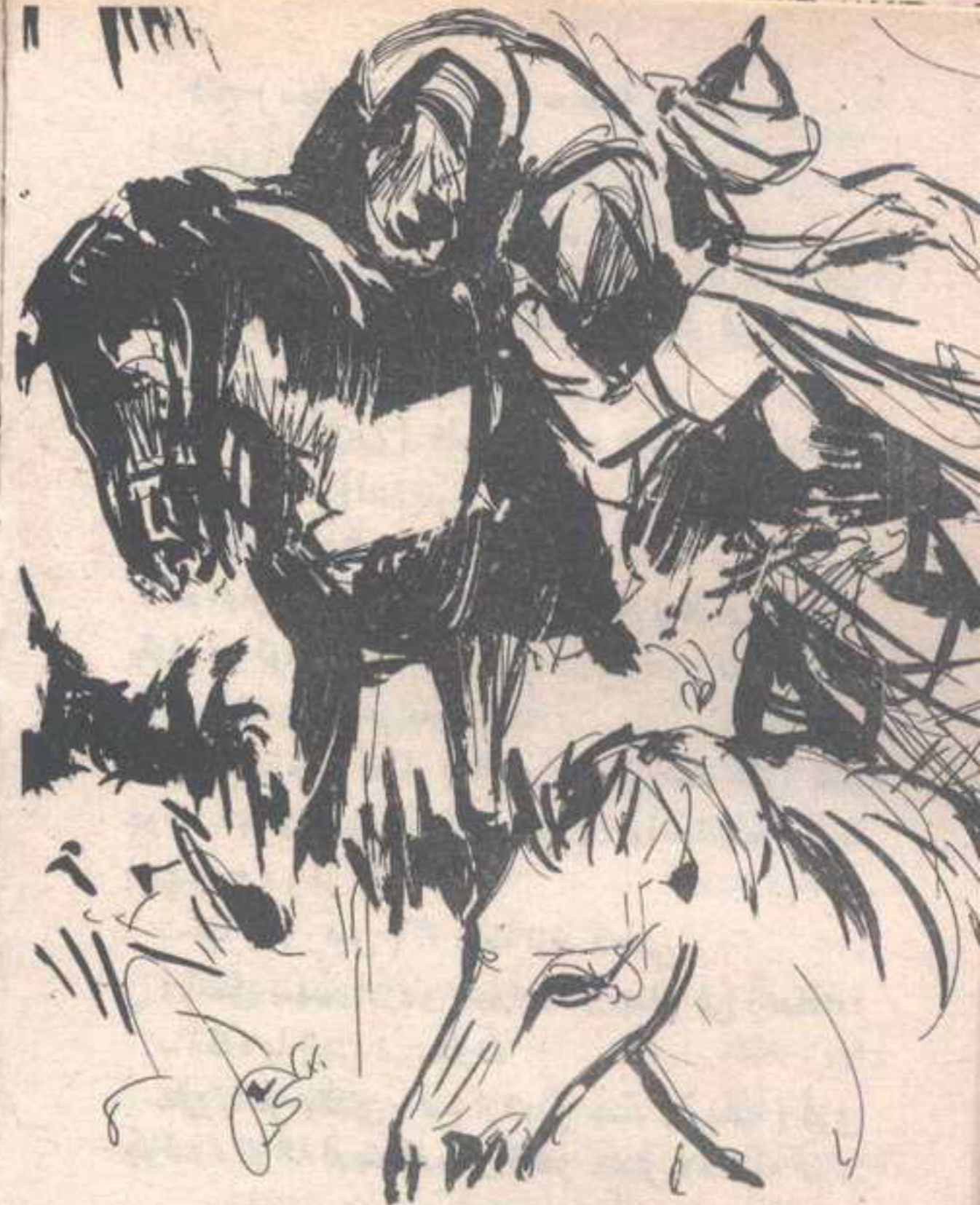
وفى حزم ، حمل ( فارس ) ، وأرقده على ظهر جواده ..