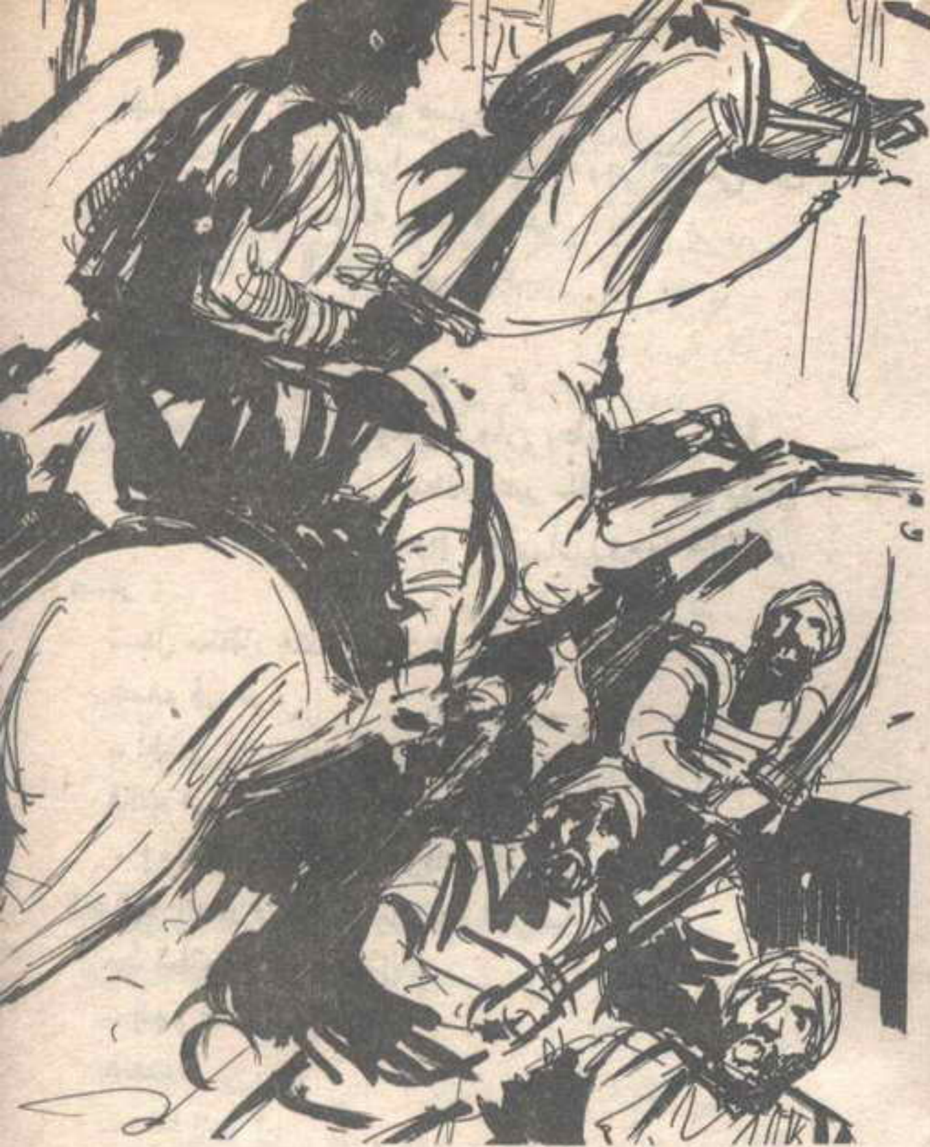
وشهق الفرسان في دهشة أقرب إلى الذهول ، عندما عبرهم الجواد الأدهم بوثة نادرة واحدة ..

فجأة صرخته المخيفة الرهيبة ، التي تزلزل قلوب أعتى الرجال ، ثم انقضّ على الجميع كالإعصار .. إعصار عاتب رهيب ، تمثل في سيف صارم بثّار ، راح يهوى على الصدور والأعناق بلا رحمة أو تردد .. وأدرك رجال ( جهلان ) أنهم أمام وحش كاسر ، وعملاق لا يشق له غبار ..