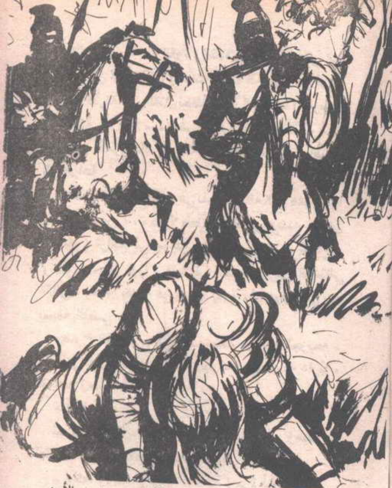
ثم هوت فوق العشب المبتل ، وانفجرت باكية ، وهي تضرب الأرض بقبضتها في مراره ويأس ..

وانفجرت باكية ، وهي تضرب الأرض بقبضتها في مرارة ويأس .. وجذب الفارسان عناني جواديهما ، وتألق الظفر في عيونهما ، وقال الأول : - لم يكن الأمر يستحق كل هذا العناء . هزّ الثاني كتفيه ، وقال بابتسامة أشبه بابتسامة الذئاب ، وهو يهبط عن صهوة جواده : - احتفظ بهذا الرأي لنفسك . ثم جذب المرأة من شعرها في قسوة ، وهو يستطرد : - إنني أدفع عمري من أجل فاتنة مثلها . لم يكذ يتم عبارته ، حتى ظهر ( فارس ) على متن جواده ، وهو يهتف في غضب : - استعد للدفع إذن أيها القشتالي . اعتدل القشتالي ، واستل سيفه في سرعة ، وشاركه زميله فعلته ، واستقبل الاثنان ( فارس ) في وحشية وشراسة ، ولكن ( فارس ) استل سيفه بدوره ، وانقضّ على القشتالي الذي يمتطي جواده ، والذي رفع ترسه ليتقى الضربة ، هاتفاً : - ابتعد أيها العربي ، وإلا .. هوى ( فارس ) بسيفه على المجنّ الذي يحمله القشتالي ، وهو يقول : - وإلا ماذا ؟