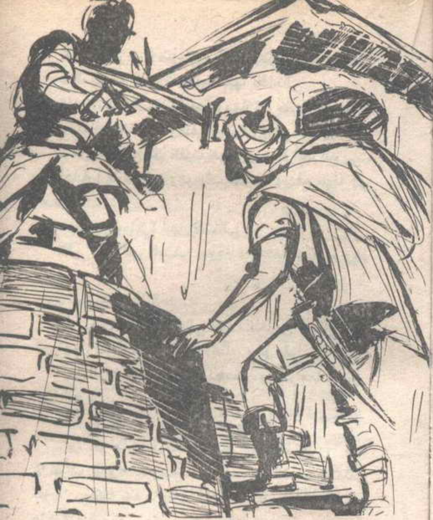
استقبل (فارس) سيف (خوان) على سيفه ، وأبعده بضربة قوية ..

فتحطم الحاجز ، وهوى ( جهلان ) معه ، وهو يطلق صرخة رهيبية ، انتهت مع ارتطامه بالأرض ، وتحطم جسده تماما .. وفي هذه الأثناء كان ( خوان ) يعدو صاعدا إلى أعلى البرج ، و ( فارس ) يطارده ، وهو يقول في صرامة :